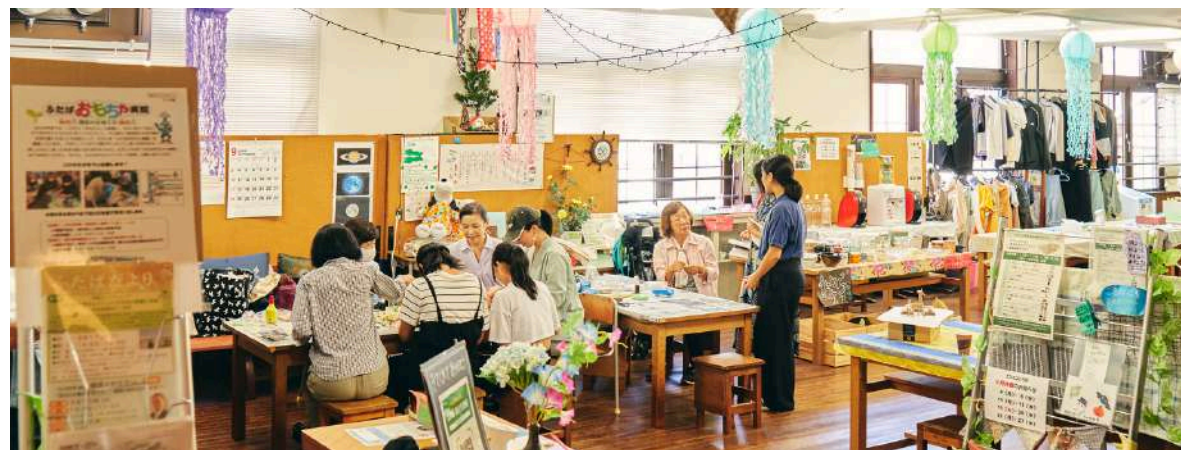
神戸市「ふたば資源回収ステーション」