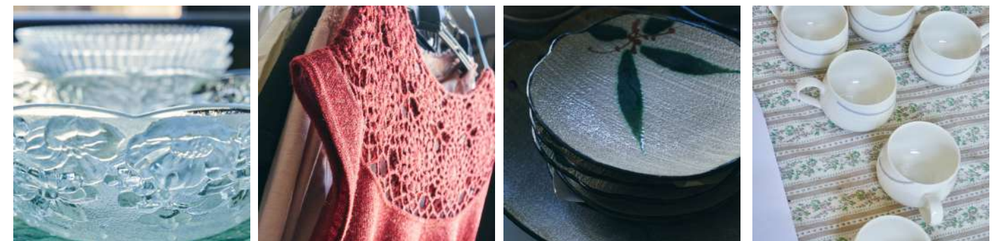
神戸市「ふたば資源回収ステーション」