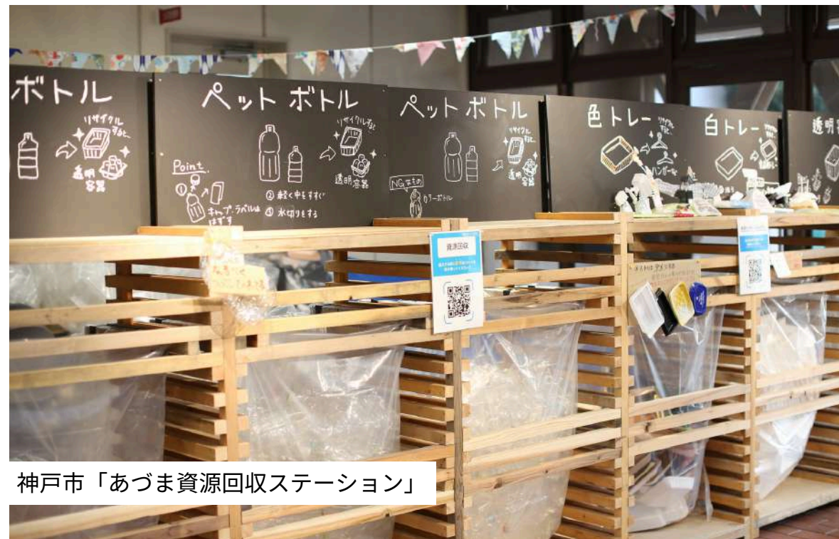
神戸市「あづま資源回収ステーション」